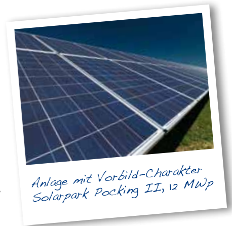
Anlage mit Vorbild-Charakter Solarpark Pocking II, 12 MWp

Sie wollen wissen, was der TÜV Rheinland zu einem unserer Projekte sagt? „ Die Photovoltaik-Anlage Pocking II stellt die bisher am besten beurteilte Anlage insgesamt dar “. (Anm.: bezieht sich auf alle inspierten PV-Anlagen des TÜV Rheinland bis 2010)