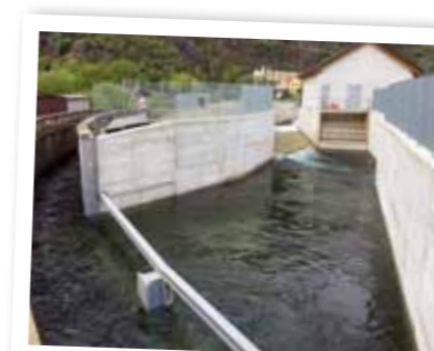
Kraftwerk Pallanzeno im Piemont: 1.100.000 kWh pro Jahr

Das vermeintlich schnelle Geld mit volatilen Modellen? Nicht bei uns. Die Ranft-Unternehmensgruppe setzt auf Ökologie und Werte, die bleiben. Als nachhaltiger Anleger und damit ökologischer Investor nehmen Sie an unserem Erfolg direkt teil – wie bereits gut 2000 Kunden. Warum?